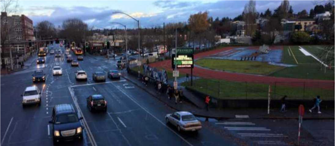
ናይ Rainier Ave S ን Martin Luther King Jr Way S መስቀላዊ መንገዲ ኣብ መንጎ ቀንዲ መዓርፎታት ዝርከብ እዩ፤ ንኣብነት፡ ናይ Mt Baker Link ቀሊል ባቡር መዓርፎ፡ ናይ King County ሜትሮ ማእከል ትራንዚት፡ Franklin ካልኣይ ብርኪ ቤት ትምህርቲ፤ ዝውጥን ናይ ቸርቻሪ ንግዲታት ይርከቡ።