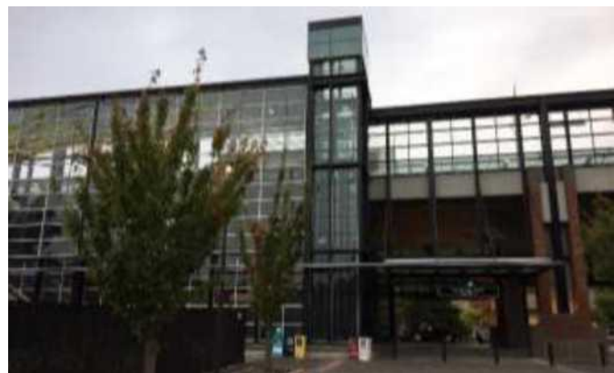
Mt Baker ቐሊል ባቡር መዓርፎ

2. ኣብ Mt Baker Station Area Planning ዝጠመተ በዓል ብዙሕ ኤጀንሲ ጉጅለ ብምትሕብባር ናይቲ ማህበረሰብ ራእይ ብዝሓሸ መንገዲ ብዝማልዕ መንገዲ ኢንቨስትመንታት ዘወሃህዱ ክግበሩ ዝኸኸሉን ጭቡጥ ዝኾኑ ስጉምቲ ንምፍላይ ክንሰርሕ ኢና። እዚ ከይዲ ዝምራሕ ድማ ብቤት ፅሕፈት ትልሚን ልምአት ማህበረሰብ እዮ።