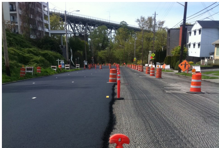
Ejemplo de obras de pavimentación del proyecto de pavimentación de SDOT de Dexter Ave N.