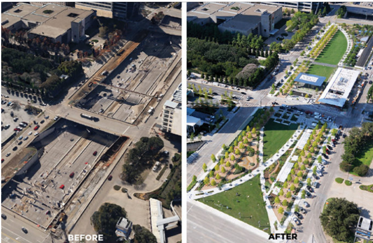
Klyde Warren Park - Dallas, TX

Seattle là một thành phố đang phát triển chóng nhanh. Thu hồi đất ở một vị trí trung tâm có thể mang lại lợi ích xã hội, môi trường, văn hóa và kinh tế. Các nấp địa phương bao gồm Trung tâm Hội nghị Bang Washington và Công viên Freeway, Tháp Thành phố Seattle và Công viên Aubrey Davis ở Đảo Mercer.